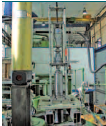
Montage der mobilen Zylinderausdrehvorrichtung an einer hydraulischen Dieffenbacher Presse.